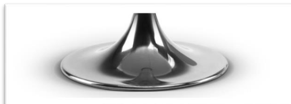
Base de aluminio pulida. RF. R7