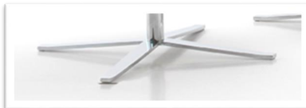
Base de 4 radios de pulida plana. RF. R7