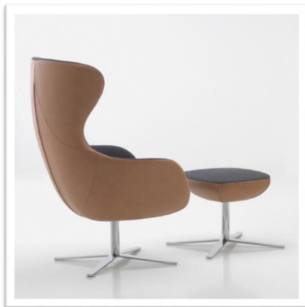
Curvy con reposapiés