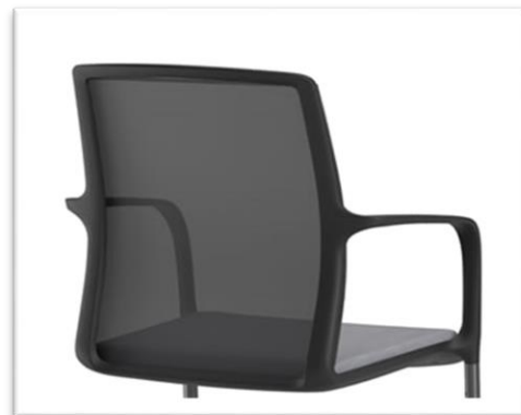
Respaldo en malla

Estructura acabada en blanco o negro o cromo.